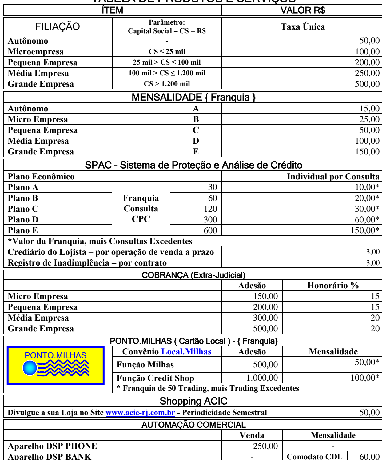
TABELA DE PRODUTOS E SERVIÇOS

Fundação 05 de fevereiro de 1997 – 11 Anos